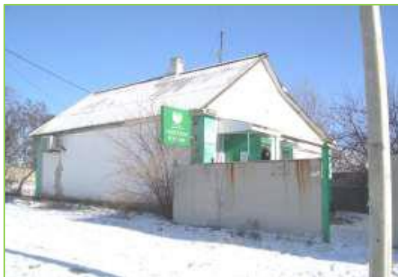
Адрес: г. Красный Сулин, ул. Октябрьская 121 Площадь: 47,8 м 2 Стоимость: 482 000 руб.