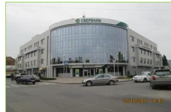
Адрес: г. Таганрог, ул. Октябрьская, 39 Площадь: 7 410,5 м 2 Стоимость: 118 000 000 руб. Банк останется на правах аренды