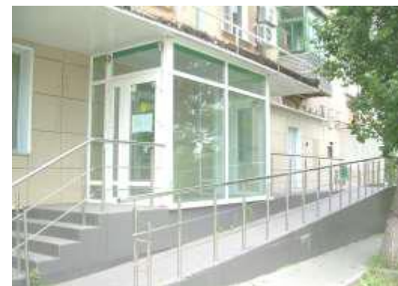
Адрес: г. Новочеркасск, ул. Ермака 36 Площадь: 127 м 2 Стоимость: 4 325 000 руб.