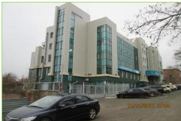
Адрес: г. Каменск-Шахтинский, пр-кт К. Маркса, 9 Площадь: 4 262 м 2 Стоимость: 83 500 000 руб. Банк останется на правах аренды