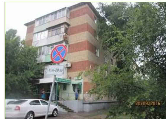
Адрес: г. Новочеркасск, ул. Силикатная 15 Площадь: 48,6 м 2 Стоимость: 1 570 000 руб.