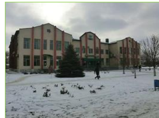
Адрес: г. Зерноград, ул. им Ленина, 2 Площадь: 1 727,7 м 2 Стоимость: 20 755 000 руб. Банк останется на правах аренды