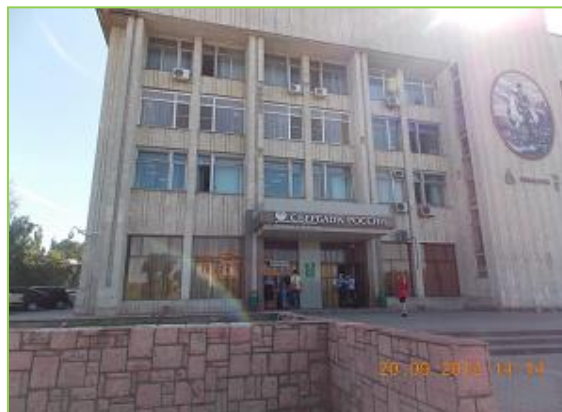
Адрес: г. Новочеркасск, пр-кт Платовский, 59Б Площадь: 2 357,2 м 2 Стоимость: 56 931 000 руб. Банк останется на правах аренды