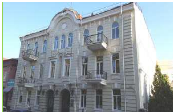
Адрес: г. Ростов-на-Дону, ул. Пушкинская, 116 Площадь: 1 225,4 м 2 Стоимость: 92 400 000 руб.