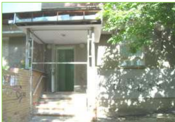
Адрес: г. Новочеркасск, ул. Каштанова 23 Площадь: 111 м 2 Стоимость: 2 430 000 руб.